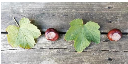
Une feuille – un marron – une feuille - un marron