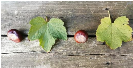
Un marron – une feuille – un marron – une feuille