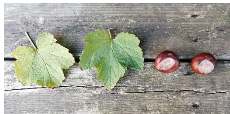
Une feuille – une feuille - un marron – un marron