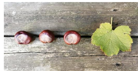
Un marron – un marron – un marron – une feuille